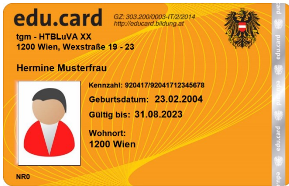
Beispiel einer personalisierten edu.card