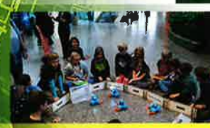
MIT EINANDER SPIELEN